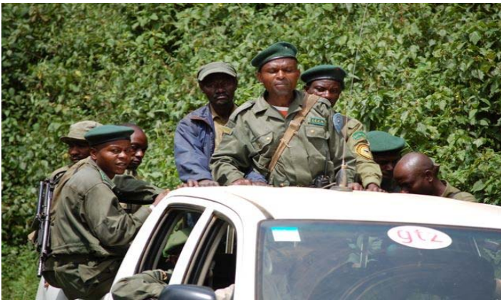
Trabajadores del Parque Nacional Kahuzi-Biega protegen el parque de los cazadores furtivos.

Aún queda mucho por hacer, todavía hay muchos simios en manos de cazadores furtivos y particulares para ser llevados al centro de recuperación.